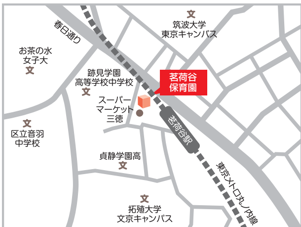
東京メトロ丸の内線「茗荷谷」駅 徒歩1分