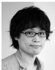
おぎう え 荻上 チキ氏