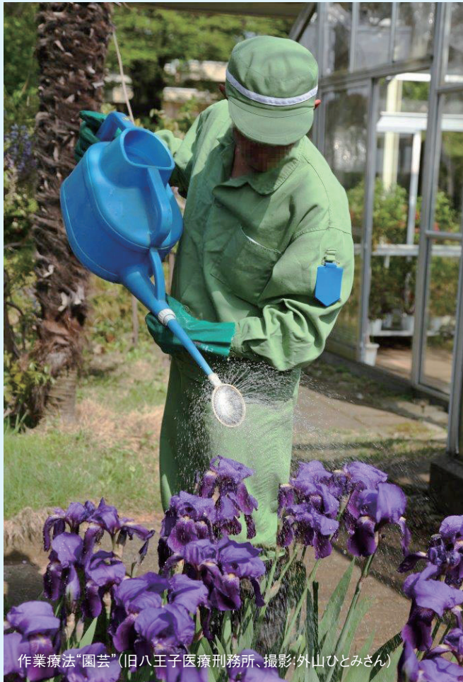
作業療法“園芸”(旧八王子医療刑務所、撮影:外山ひとみさん)