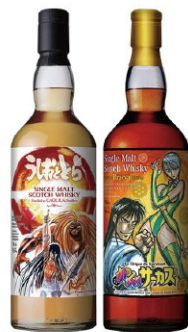
『うしおととら』『からくりサーカス』 ラベル・ウイスキー ©藤田和日郎/小学館