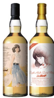
『タッチ』ラベル・ウイスキー ©あだち充/小学館