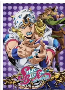
©荒木飛呂彦&LUCKY LAND COMMUNICATIONS/ 集英社・ジジョの奇妙な冒険 THE ANIMATION PROJECT