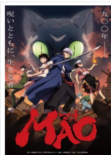
原作/高橋留美子「MAO」 小学館「週刊少年サンデー」連載