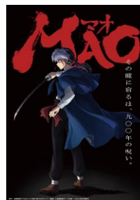
原作/高橋留美子「MAO」(小学館「週刊少年サンデー」連載) ©高橋留美子/小学館/「MAO」製作委員会