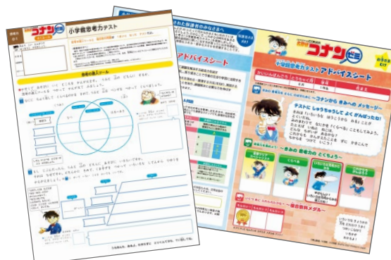
「小学館思考力テスト」と「アドバイスシート」