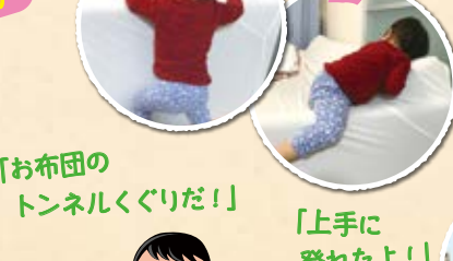
「お布団のトンネルくぐりだ!」