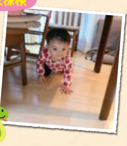
「へびさんの目線はこんなかな?」 「椅子とテーブルの間を上手に進むぞ~」