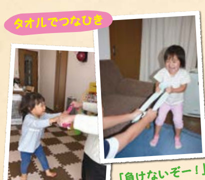
タオルでつなびき 「負けないぞー!」 「タオルのお団子に届くかな?」

A 子どもも大人と同じように発散できないエネルギーが溜まれば、ストレスを感じます。お家でも簡単にできて体をたくさん動かせる、 タオルを使った遊び をご紹介します。 つなびきで力試し 、 掴み遊び 、 タオルを平均台に見立てたバランス遊び など、タオル1本でたくさんの遊びが展開できます。