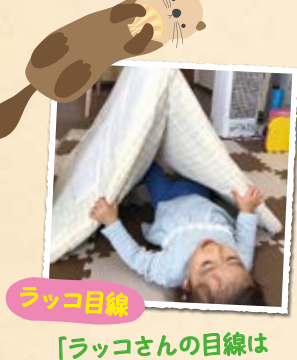
ラッコ目線 「ラッコさんの目線はこんな感じかな?」 「いつもと違う景色!」

A 広い場所で遊ばせてあげたいと思う一方、多くの方が利用できる場所が心配という方も多いと思います。 家の中の探検あそび をご紹介します。 へびの目線 や ラッコの目線 で見ると、見慣れた場所も違った風に見える子どもの好奇心を掻き立てます。「ラッコさん何が見えるかな?」など声かけも大切です。もう少し大きくなったら、椅子や家具で迷路ごっこなども楽しいでしょう。