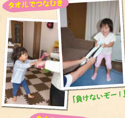
タオルでつなびき 「負けないぞー!」 「タオルのお団子に届くかな?」

A 子どもも大人と同じように発散できないエネルギーが溜まれば、ストレスを感じます。お家でも簡単にできて体をたくさん動かせる、 タオルを使った遊び をご紹介します。 つなびきで力試し 、 掴み遊び 、 タオルを平均台に見立てたバランス遊び など、タオル1本でたくさんの遊びが展開できます。