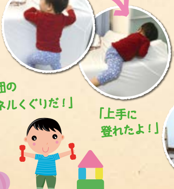
よじ登り 「上手に登れたよ!」