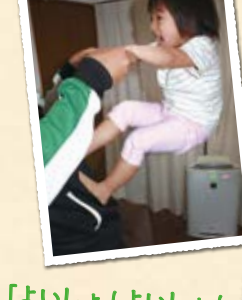
「よしよ！よしよ！どこまで登れるかな!？」

体のぼり 大人の体によじ登ることも全身を使った運動になります。しっかり手を繋ぎ安全に配慮してあそびましょう。