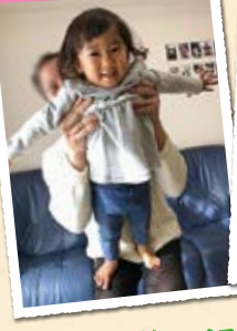
「パパのお膝にバランス立ち!上手~」