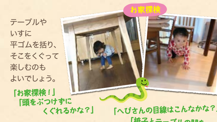
へび目線 「へびさんの目線はこんなかな?」 「椅子とテーブルの間を上手に進むぞ~」