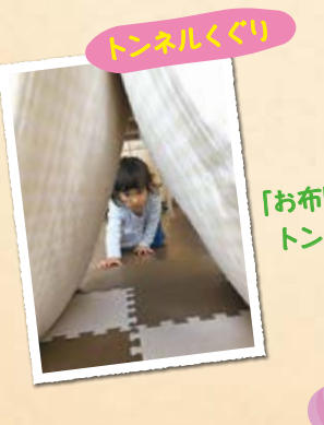
トンネルくぐり 「お布団のトンネルくぐりだ!」