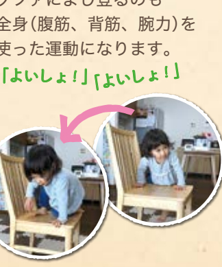
ソファによじ登るのも全身(腹筋、背筋、腕力)を使った運動になります。「よしよ!」「よしよ!」

Q 外で遊ぶ機会が減ってしまったせいか、子どもが物を投げたり、叩いたりすることが増えた気がします。遊びで発散させたり気分転換になるいい対策はありますか?(3歳/女児のママ)