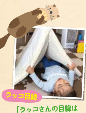
ラッコ目線 「ラッコさんの目線はこんな感じかな?」 「いつもと違う景色!」

A 広い場所で遊ばせてあげたいと思う一方、多くの方が利用できる場所が心配という方も多いと思います。 家の中の探検あそび をご紹介します。 へびの目線 や ラッコの目線 で見ると、見慣れた場所も違った風に見える子どもの好奇心を掻き立てます。「ラッコさん何が見えるかな?」など声かけも大切です。もう少し大きくなったら、椅子や家具で迷路ごっこなども楽しいでしょう。