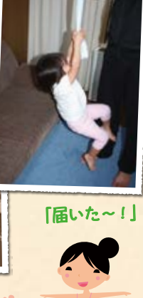
「届いた~!」 「細い道も進めるか挑戦!」