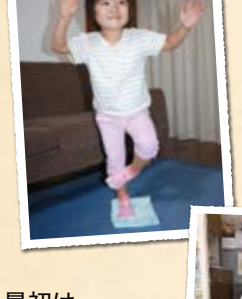
タオルでバランス 「何秒間立ってられるかな?」