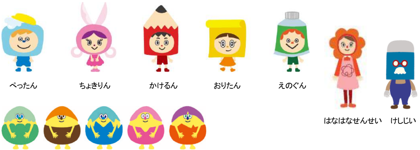
まなびのようせい「まなだま」